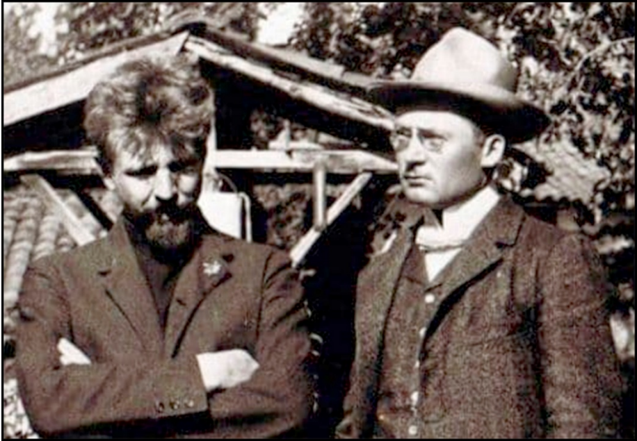
Otto Gross y Carl Jung en 1908